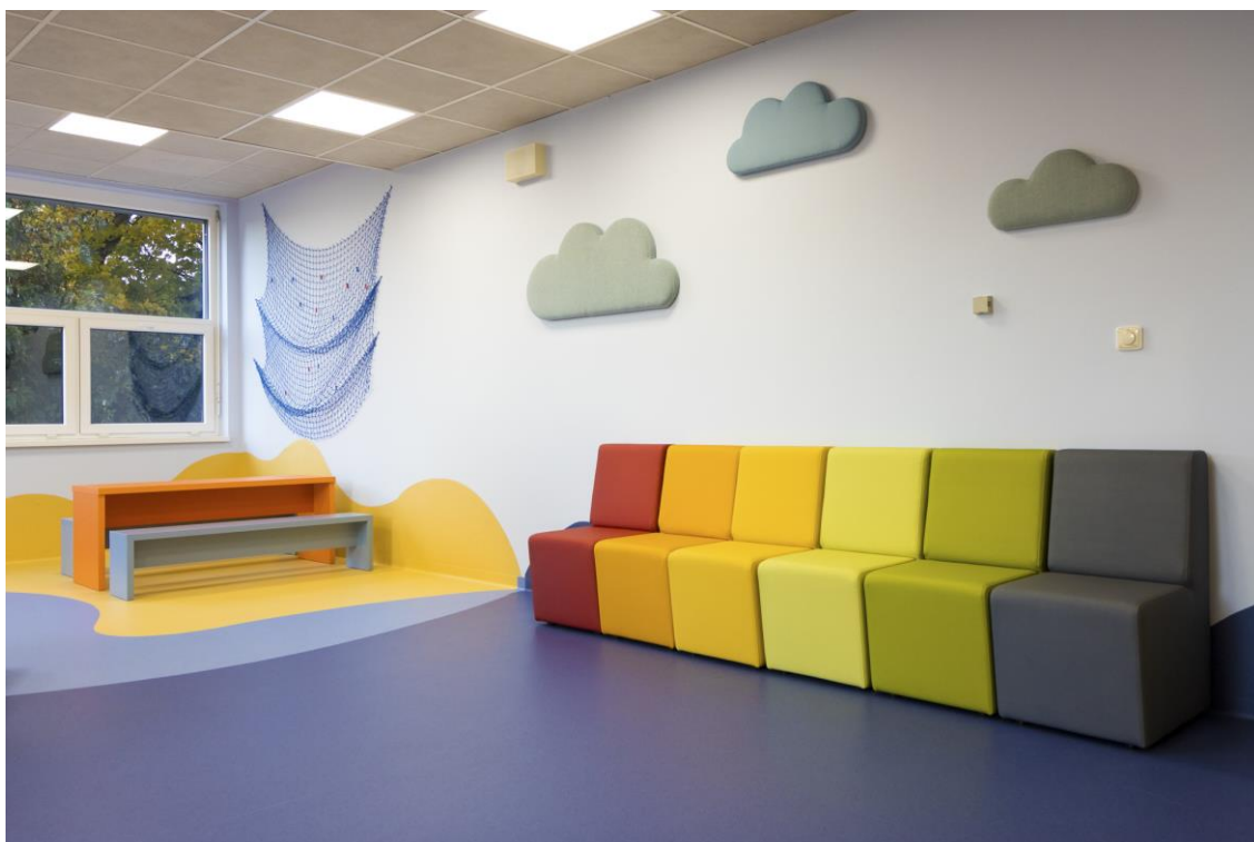
Herna – Psychiatrická klinika Fakultní nemocnice Hradec Králové