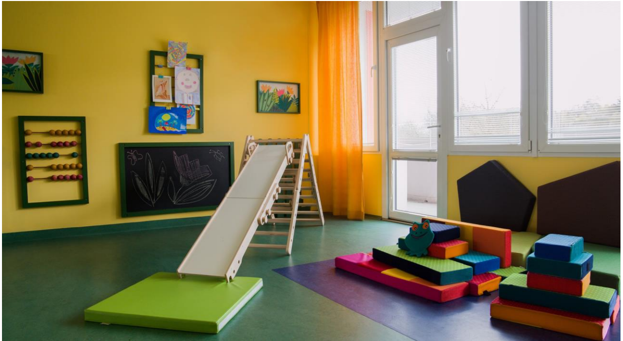
Čekárna – Dětské a dorostové oddělení, Nemocnice Most