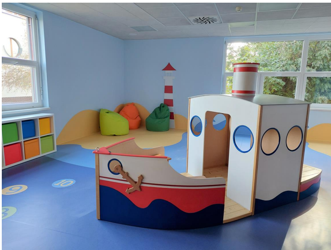
Herna – Psychiatrická klinika Fakultní nemocnice Hradec Králové