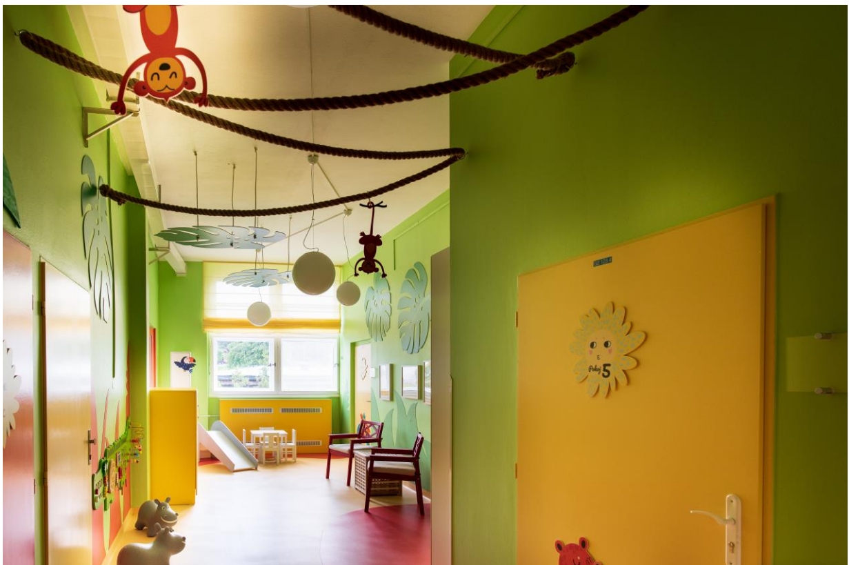
Herna – Plicní oddělení, Pediatriká klinika FTN Praha