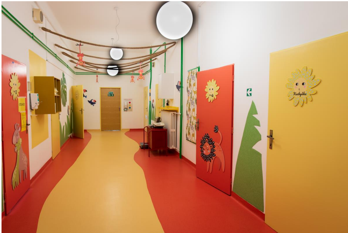
Chodba – Plicní oddělení, Pediatriká klinika FTN Praha