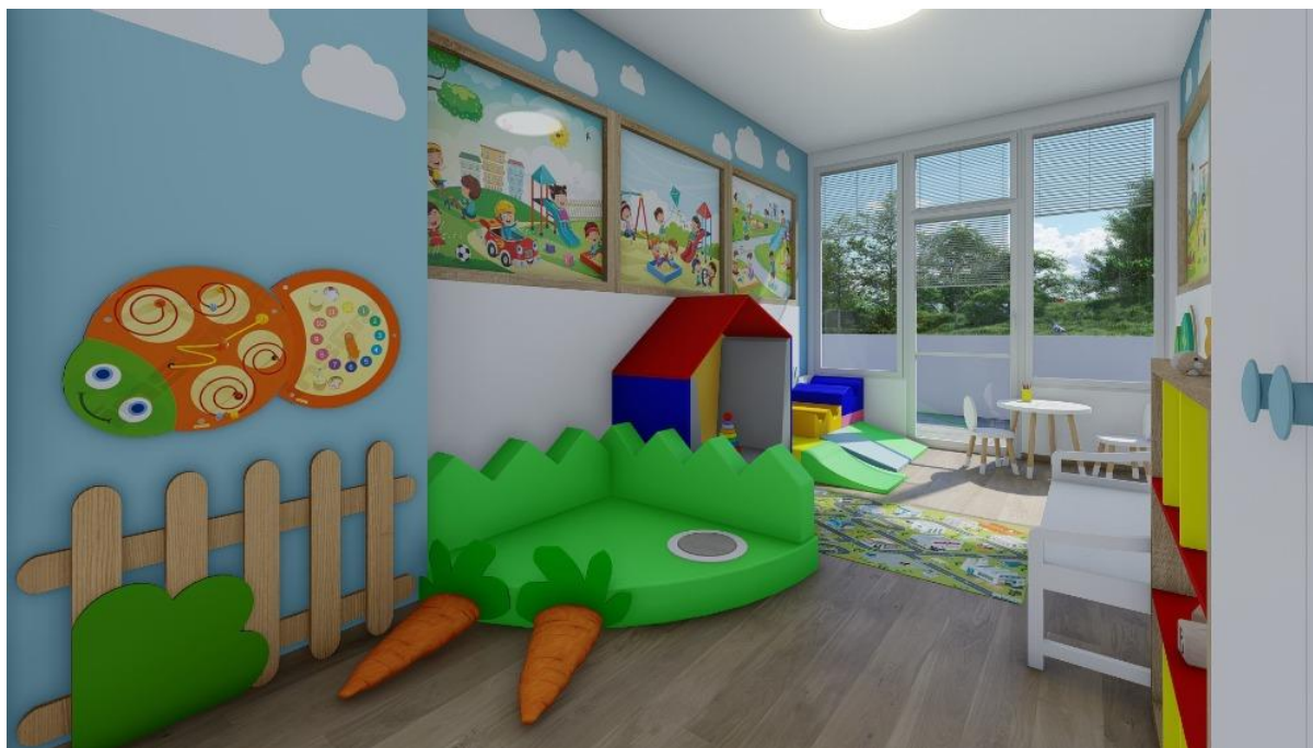
Ukázka vizualizace z projektu „Herna Park“ - Dětské oddělení v Nemocnici v Mostě