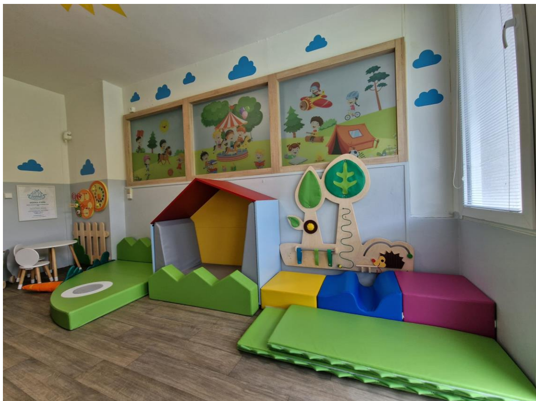
Realizace - Herna – Dětské a dorostové oddělení, Nemocnice Most